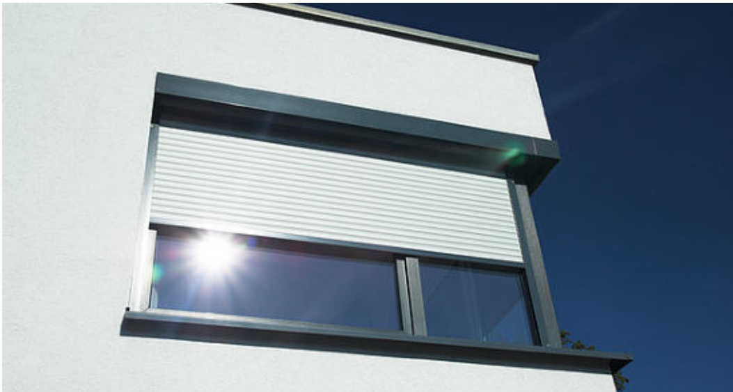
Abb.: Rollladen

Der Rollladen wird in der Regel außen am Fenster oder der Fassade montiert. Er erfüllt die Eigenschaften Schallschutz, Sichtschutz, Sonnenschutz, Wärmedämmung.